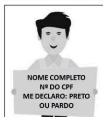
Figura 3 - Modelo de autodeclaração para o vídeo.