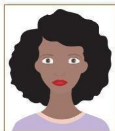
Figura 1. Modelo de Foto Frontal.