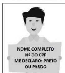
Figura 3 - Modelo de autodeclaração para o vídeo.