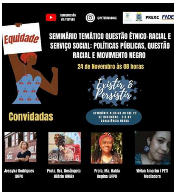
Imagem 2: Banner de Divulgação