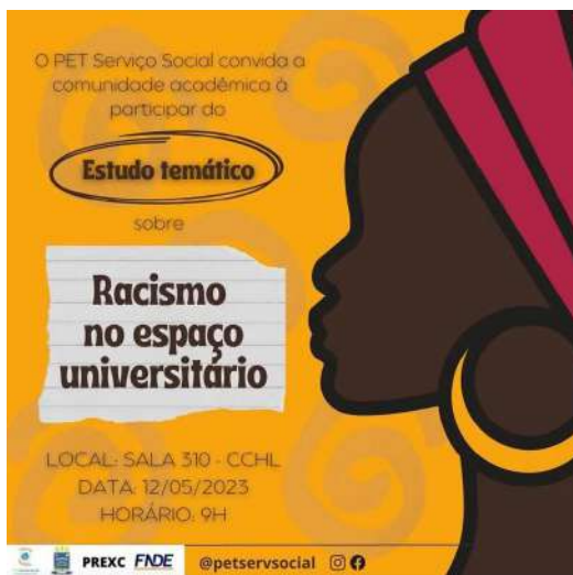
Imagem 3: Banner de divulgação