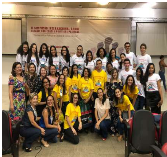
Docentes e discentes da organização do II SINESPP