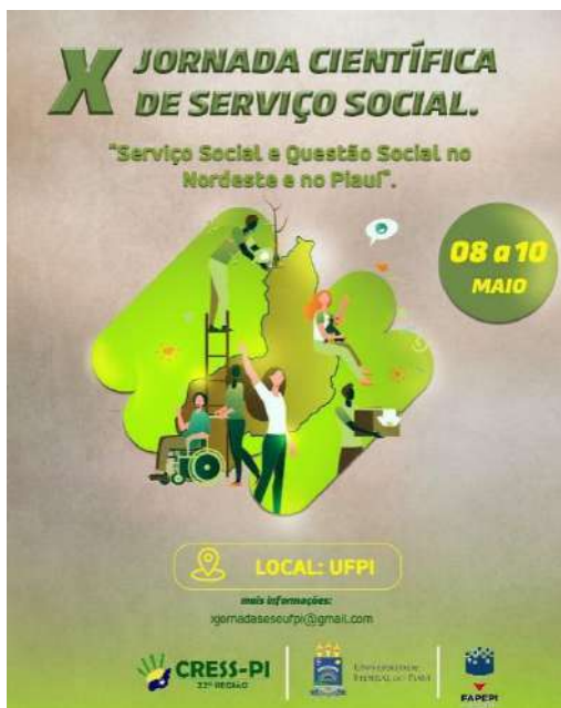
Figura 5 – Arte de Divulgação da X Jornada Científica de Serviço Social

A décima edição da Jornada, com o tema “Serviço Social e Questão Social no Nordeste e no Piauí” ocorreu nos dias 8 a 10 de maio de 2023 e foi organizada pelo departamento de Serviço Social em conjunto com o Conselho Regional de Serviço Social 22º região - CRESS Piauí, com o Programa de Pós-Graduação em Políticas Públicas - PPGPP/UFPI e com a Fundação de Amparo à Pesquisa do Estado do Piauí - FAPEPI.