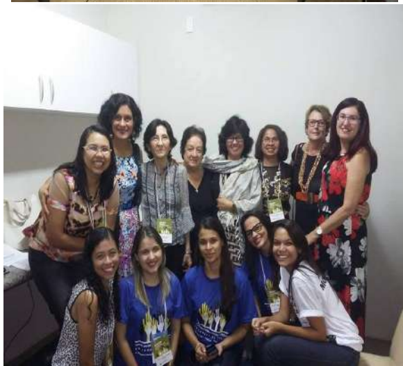
Docentes e discentes do PGPP e palestrantes do I SINESPP