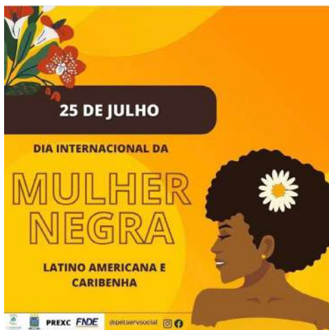
Imagem 4: Banner de divulgação