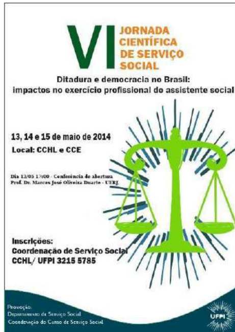
Figura 1 - Arte de Divulgação da VI Jornada Científica de Serviço Social