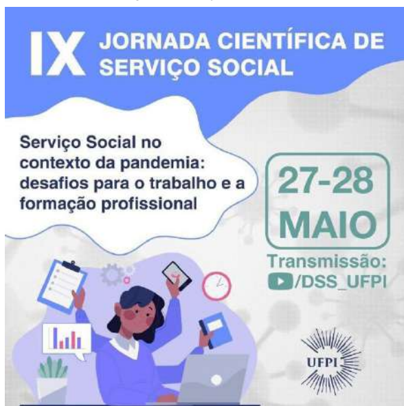
Figura 4 – Arte de Divulgação da IX Jornada Científica de Serviço Social

“Serviço Social no contexto da pandemia: desafios para a formação e o trabalho”. A programação do evento foi desenvolvida de forma remota, com o apoio das tecnologias digitais de informação e comunicação, com transmissão online através do Youtube e do Google Meet , em decorrência da suspensão das atividades presenciais na Universidade Federal do Piauí, pela necessidade de resguardar a saúde da comunidade universitária e mitigar a transmissão da Covid-19 (Pereira, 2021).