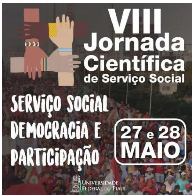
Figura 3 – Arte de Divulgação da VIII Jornada Científica de Serviço Social

Assim como nas demais edições, na VIII Jornada Científica de Serviço Social os trabalhos foram submetidos ao Comitê Científico a partir de seis eixos temáticos: I - Democracia, participação e movimentos sociais; II - Serviço social: formação e trabalho profissional; III - Gênero, Raça/Etnia e Sexualidades; IV - Serviço Social e Políticas Públicas; V - Desigualdades sociais e pobreza; VI - Questões geracionais: infância, juventude e idoso, sendo aprovados para apresentação 72 resumos.