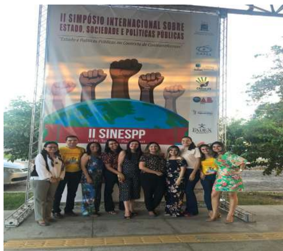
Docentes e discentes da organização do II SINESPP