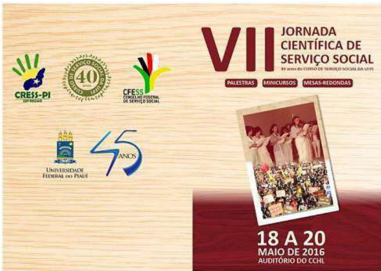
Figura 2 – Arte de Divulgação da VII Jornada Científica de Serviço Social

Em 2016, o Curso de Serviço Social na Universidade Federal do Piauí celebrou 40 anos de sua criação, fato que motivou a temática e a programação da VII Jornada Científica, realizada de 18 a 20 de maio, no Auditório do CCHL. Na imagem 2, é possível apreciar a arte de divulgação: