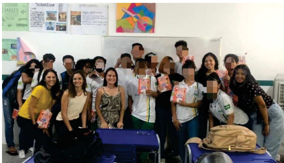
Figura 03 - Registro do curso de Alimentação Saudável e Boas Práticas de Alimentação, Teresina/PI, Brasil.