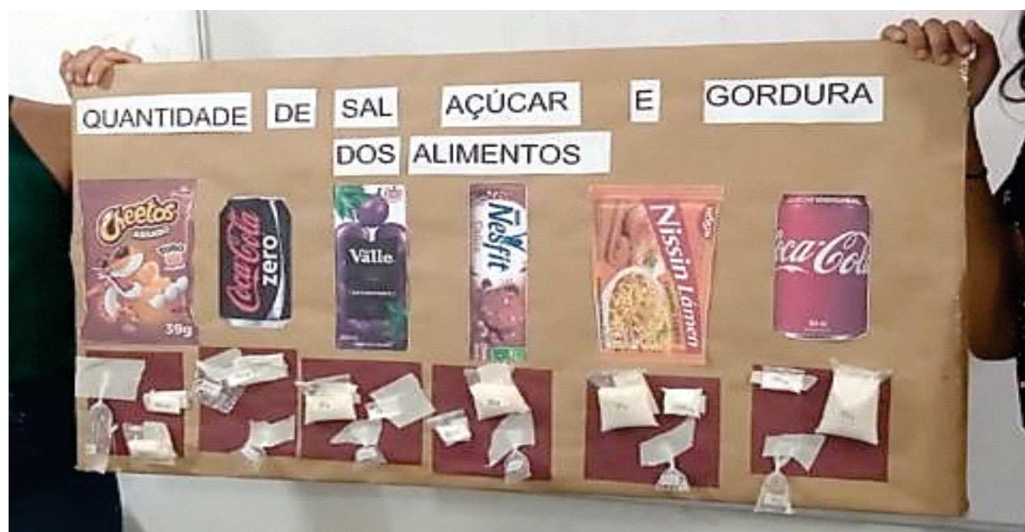
Figura 02 - Quadro comparativo com teor de sal, açúcar e gordura.