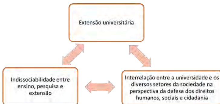
Figura 1 – Fundamentos do Programa de Ações Integradas de Promoção de Direitos Humanos, Sociais e Cidadania - PRAIDIH

Universidade Federal do Piauí e desenvolve um conjunto de ações tendo como foco a promoção de direitos humanos e sociais dos diversos segmentos e grupos afetados pelas expressões da questão social e que se encontram em situação de vulnerabilidade, risco ou violação de direitos, frente aos processos de envelhecimento, violências, situação de rua, encarceramento, dentre outros.