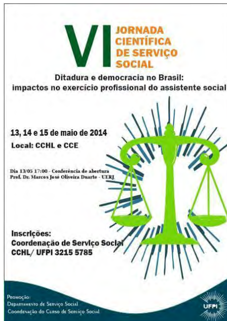
Figura 1 - Arte de Divulgação da VI Jornada Científica de Serviço Social