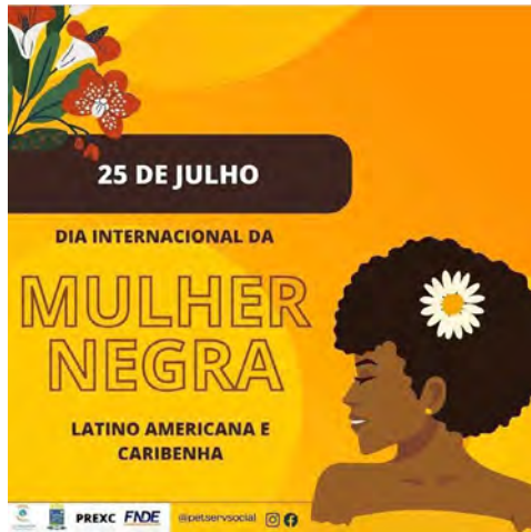
Imagem 4: Banner de divulgação