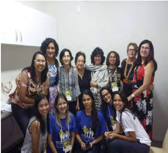
Docentes e discentes do PGPP e palestrantes do I SINESPP