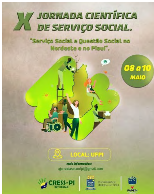
Figura 5 – Arte de Divulgação da X Jornada Científica de Serviço Social

A décima edição da Jornada, com o tema “Serviço Social e Questão Social no Nordeste e no Piauí” ocorreu nos dias 8 a 10 de maio de 2023 e foi organizada pelo departamento de Serviço Social em conjunto com o Conselho Regional de Serviço Social 22º região - CRESS Piauí, com o Programa de Pós-Graduação em Políticas Públicas - PPGPP/UFPI e com a Fundação de Amparo à Pesquisa do Estado do Piauí - FAPEPI.