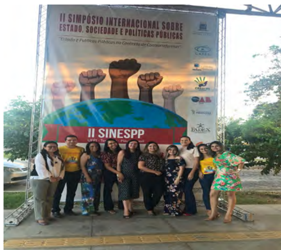
Docentes e discentes da organização do II SINESPP