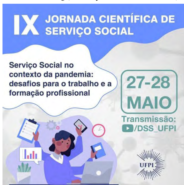
Figura 4 – Arte de Divulgação da IX Jornada Científica de Serviço Social

“Serviço Social no contexto da pandemia: desafios para a formação e o trabalho”. A programação do evento foi desenvolvida de forma remota, com o apoio das tecnologias digitais de informação e comunicação, com transmissão online através do Youtube e do Google Meet , em decorrência da suspensão das atividades presenciais na Universidade Federal do Piauí, pela necessidade de resguardar a saúde da comunidade universitária e mitigar a transmissão da Covid-19 (Pereira, 2021).