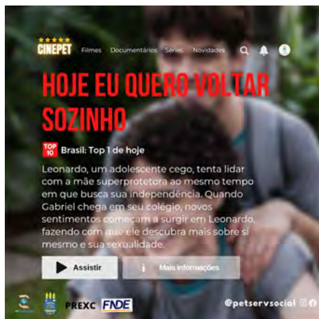
Imagem 2: Banner de Divulgação