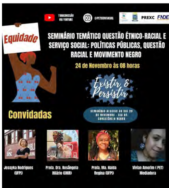
Imagem 2: Banner de Divulgação