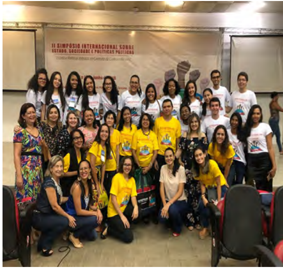
Docentes e discentes da organização do II SINESPP