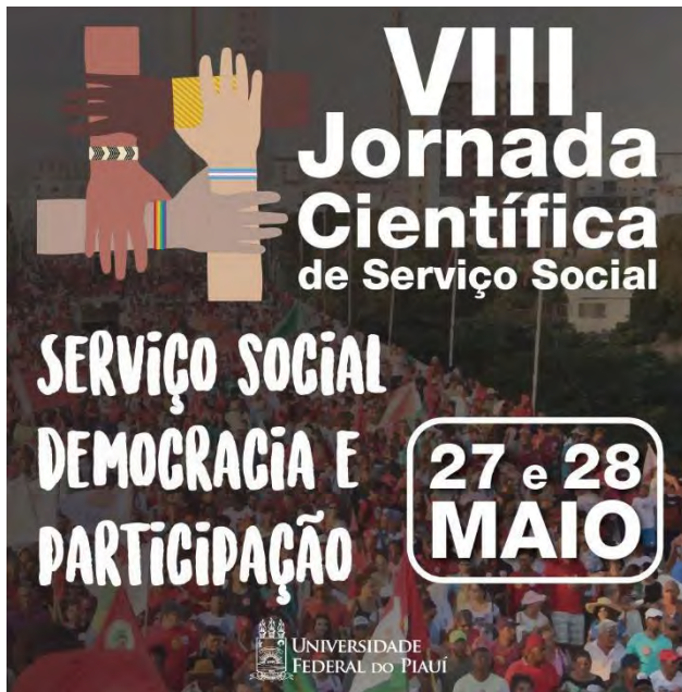
Figura 3 – Arte de Divulgação da VIII Jornada Científica de Serviço Social

Assim como nas demais edições, na VIII Jornada Científica de Serviço Social os trabalhos foram submetidos ao Comitê Científico a partir de seis eixos temáticos: I - Democracia, participação e movimentos sociais; II - Serviço social: formação e trabalho profissional; III - Gênero, Raça/Etnia e Sexualidades; IV - Serviço Social e Políticas Públicas; V - Desigualdades sociais e pobreza; VI - Questões geracionais: infância, juventude e idoso, sendo aprovados para apresentação 72 resumos.