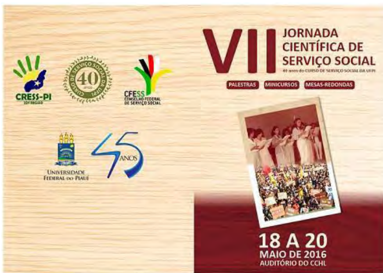
Figura 2 – Arte de Divulgação da VII Jornada Científica de Serviço Social

Em 2016, o Curso de Serviço Social na Universidade Federal do Piauí celebrou 40 anos de sua criação, fato que motivou a temática e a programação da VII Jornada Científica, realizada de 18 a 20 de maio, no Auditório do CCHL. Na imagem 2, é possível apreciar a arte de divulgação: