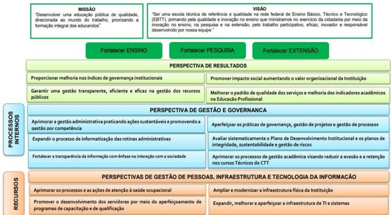
Figura 2 – Mapa estratégico do Colégio Técnico de Teresina