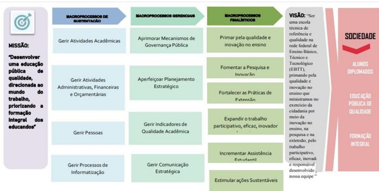
Figura 1 – Cadeia de valor do Colégio Técnico de Teresina