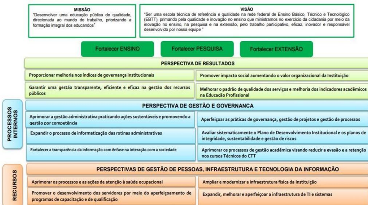
Figura 2 – Mapa estratégico do Colégio Técnico de Teresina