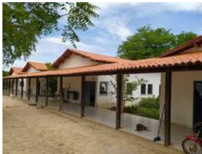
Figura 02. Setor de Agroindústria da Fazenda do Colégio Técnico de Floriano

Nesse contexto, para o desenvolvimento de atividades práticas inerentes à área de agropecuária, o CTF dispõe de uma fazenda experimental, com área total de 153 ha, localizada a aproximadamente 08 km do prédio sede do CTF. Essa fazenda é dividida em três setores assim especificados: Setor de Fitotecnia - onde são desenvolvidas as atividades relacionadas à produção vegetal (Fruticultura, Grandes Culturas e Olericultura); Setor de Zootecnia, com áreas destinadas às práticas de Produção Animal, tais como Inseminação Artificial, Hipofisação de Tambaquis e Reversão sexual de Tilápias, e Setor de Agroindústria, onde estão localizados os laboratórios de processamento de produtos de origem animal e vegetal (Agroindústria de Laticínios, Agroindústria de carne, Agroindústria de vegetais e Casa do Mel). Vale ressaltar que os produtos oriundos destes setores são encaminhados prioritariamente para abastecimento do restaurante do Campus Amílcar Ferreira Sobral – CAFS.