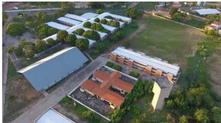
Figura 01. Vista aérea do Colégio Técnico de Floriano

O Colégio Técnico de Floriano (CTF), situado na microrregião do Sudoeste Piauiense, localizado no município de Floriano, na rodovia BR 343, Bairro Meladão, a uma distância de 3,5 km do centro da cidade e extensão territorial de 122.685 m 2 , é um colégio de Educação Profissional vinculado à Universidade Federal do Piauí (UFPI), sediada em Teresina, Capital deste Estado.