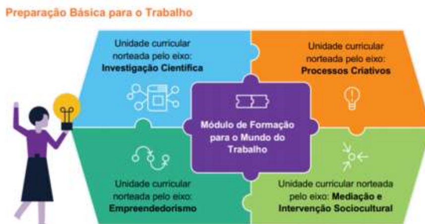
Figura 03. Eixos estruturantes

O arranjo curricular do 5º itinerário formativo busca o desenvolvimento da Educação Técnica Profissional, articulada à formação para o mundo do trabalho organizada nos seguintes eixos estruturantes: