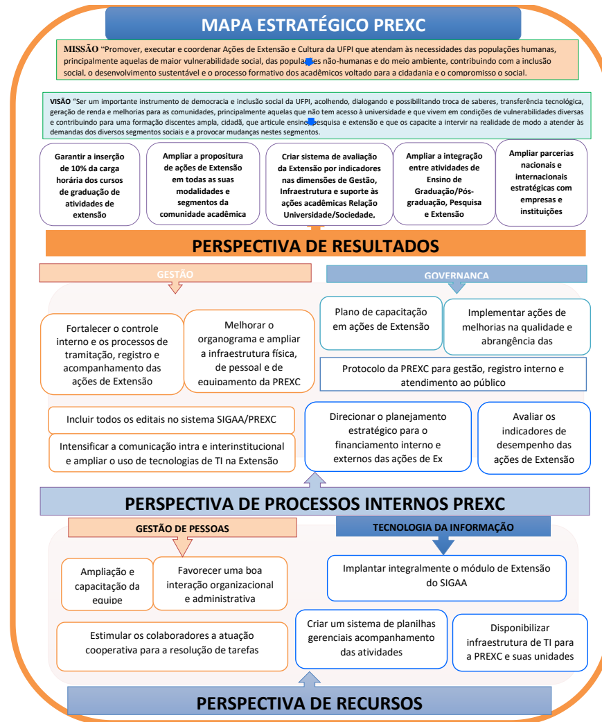
Figura 2: Mapa Estratégico da PREXC