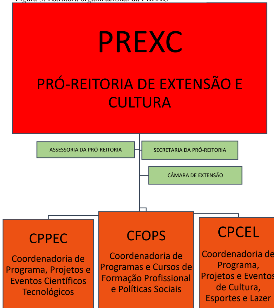
Figura 3: Estrutura organizacional da PREXC