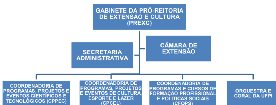
Figura 1: Organograma PREXC.

A Pró-Reitoria de Extensão e Cultura compreende a seguinte estrutura organizacional: