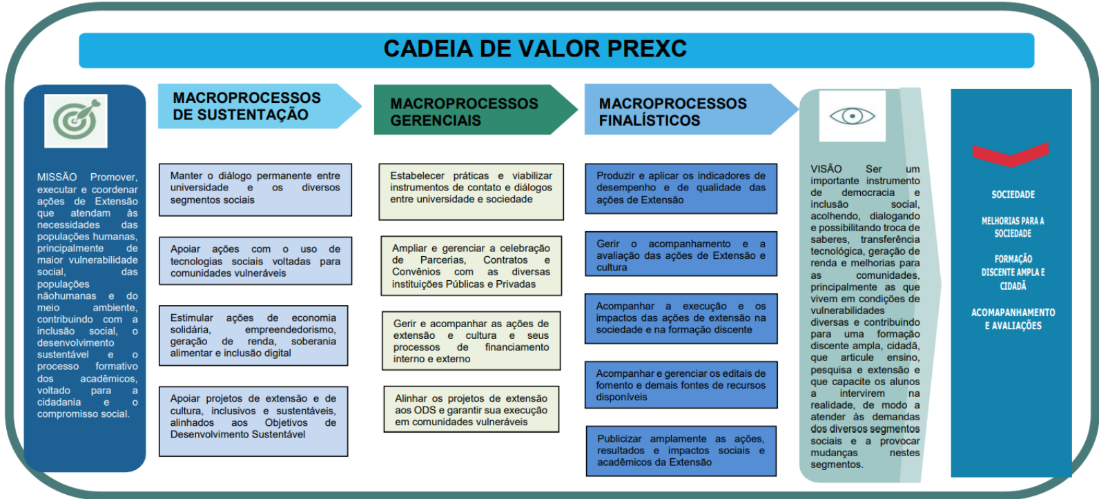
Figura 3: Cadeia de Valor PREXC.