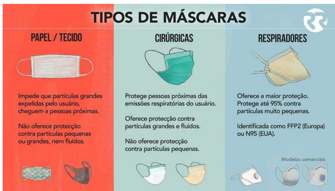
Figura 2 – Eficiência de diferentes tipos de máscaras na proteção de aerossóis.

Portanto, o uso de máscara evita a propagação da COVID-19 de maneira eficaz, principalmente quando a máscara utilizada é uma N95 bem ajustada ao rosto. Entretanto, mesmo em casos de falta de N95, as máscaras de tecido combinadas com o distanciamento social ajudam a diminuir a propagação. Assim, entende-se por que é tão necessário o uso de máscara nesse momento.