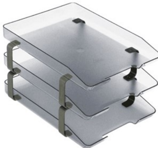
(Lote 01 – Item 07)