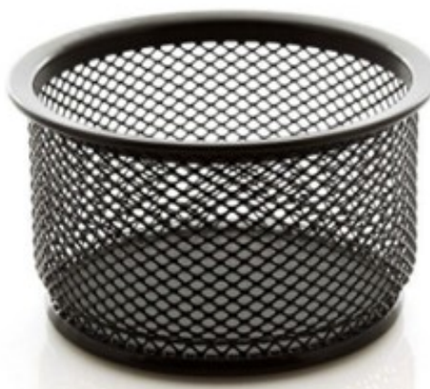
(Lote 01 – Item 83)