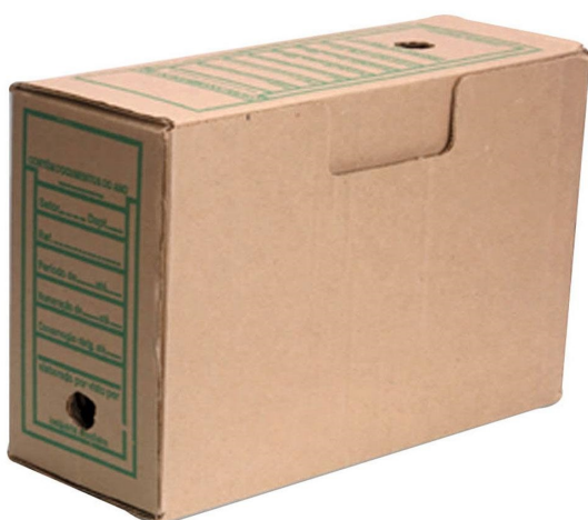
(Lote 01 – Item 16)

Calculadora Científica De Bolso Kk-98ms 10 Dígitos E 2 Linhas Com Capa