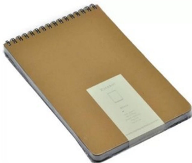
(Lote 01 – Item 11)