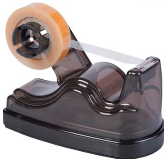
(Lote 01 – Item 84)