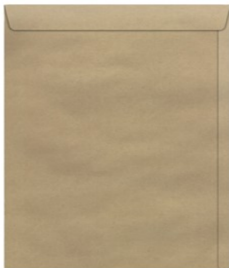
(Lote 01 – Item 39)