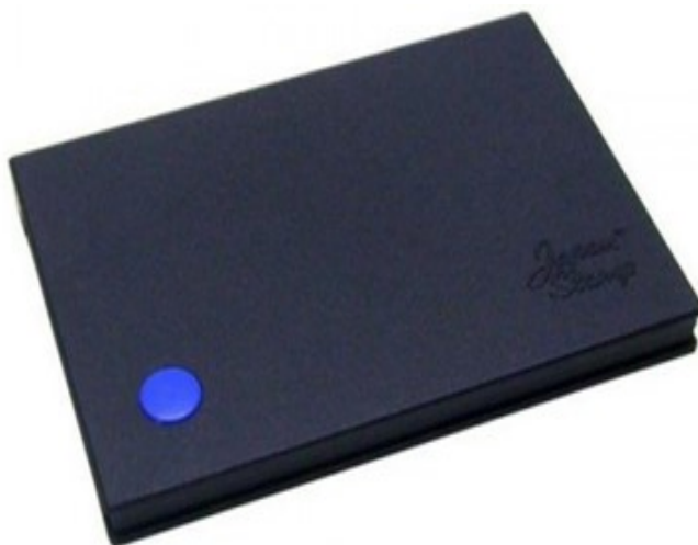
(Lote 01 – Itens 02 e 03)