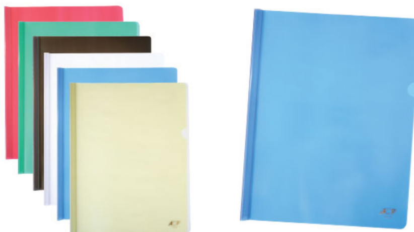
(Lote 01 – Item 79)