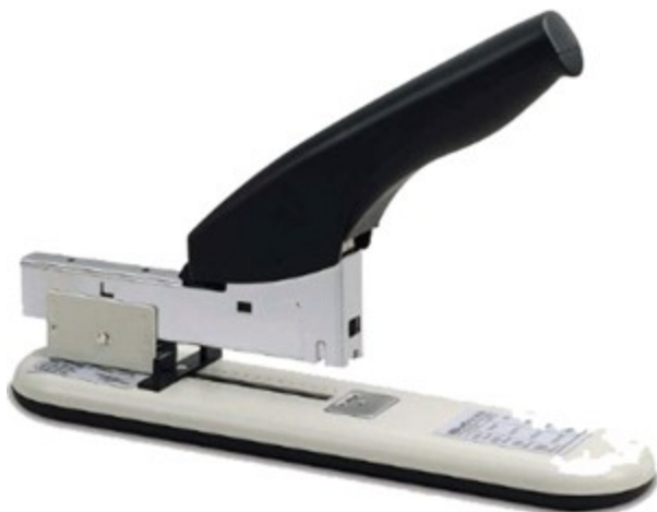
(Lote 01 – Item 58)