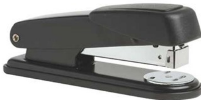
(Lote 01 – Item 57)