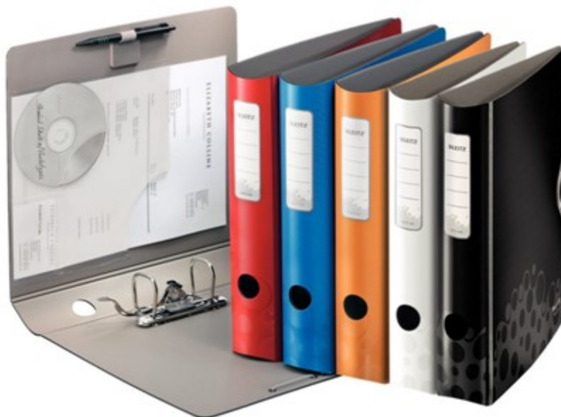
(Lote 01 – Item 78)