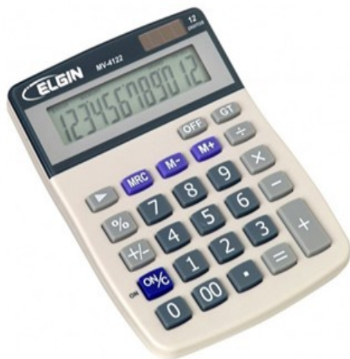
(Lote 01 – Item 19)