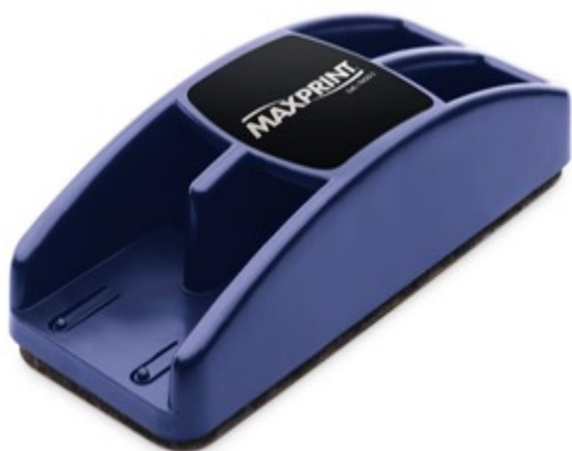
(Lote 01 – Item 04)