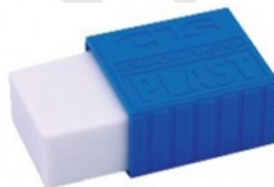
[Lote 01 – Item 12]