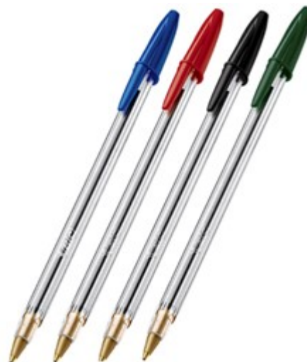
(Lote 01 – Itens 20, 21 e 22)