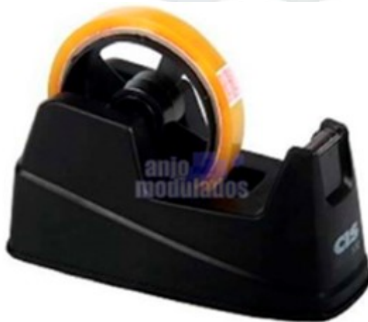
(Lote 01 – Item 85)