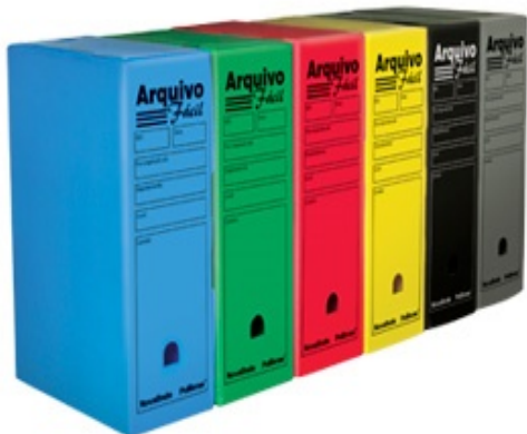
(Lote 01 – Item 06)