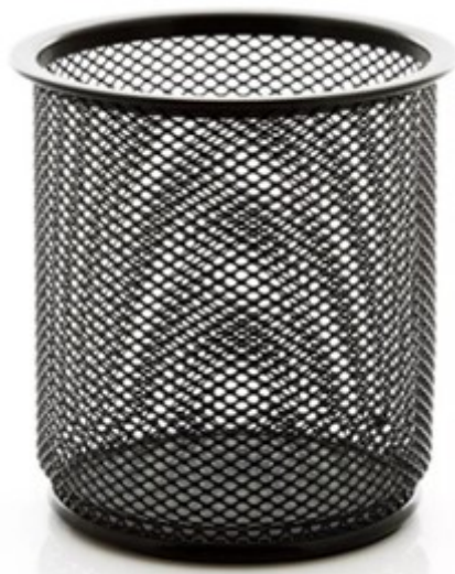
(Lote 01 – Item 82)