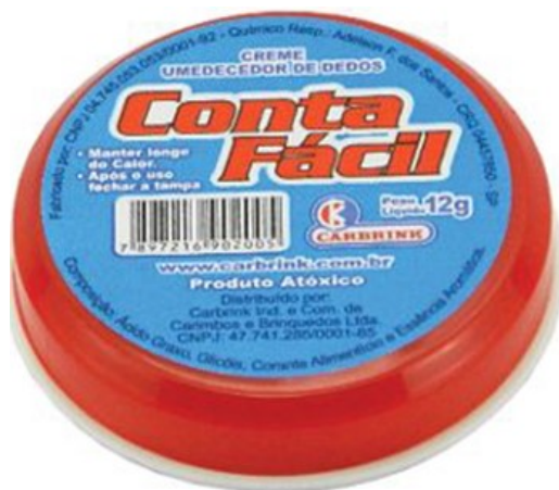
(Lote 01 – Item 74)