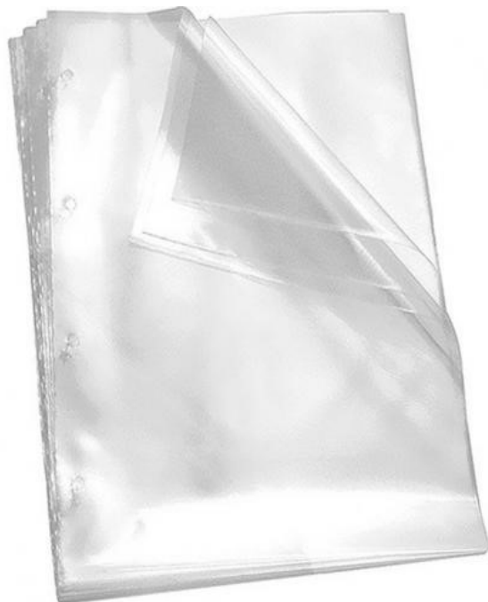
(Lote 01 – Item 86)