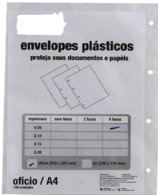
(Lote 01 – Item 87)