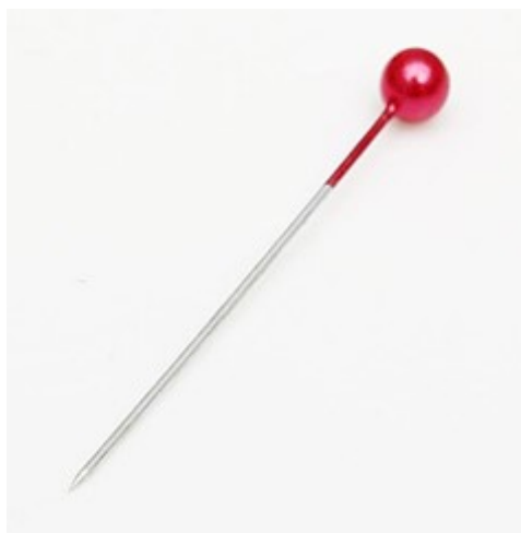
(Lote 01 – Item 01)