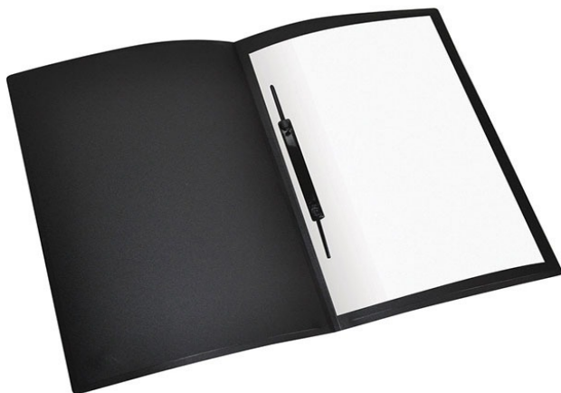
(Lote 01 – Item 76)