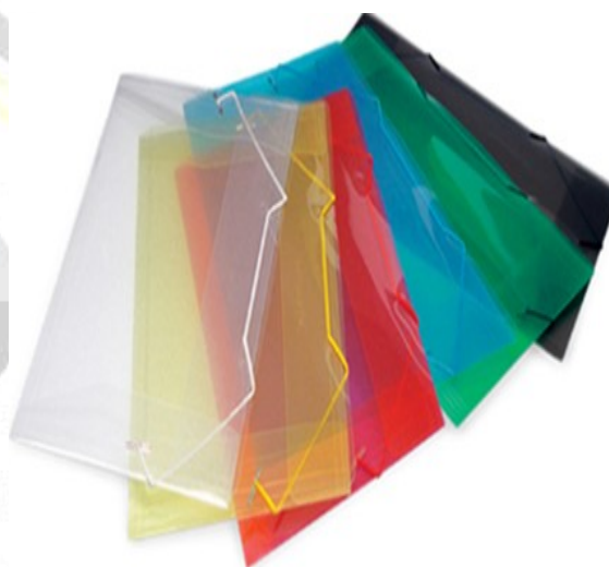
(Lote 01 – Item 77)