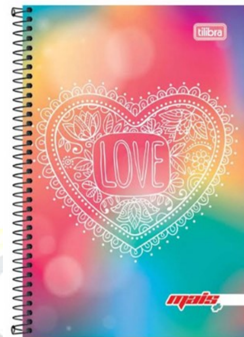
(Lote 01 – Item 14)

Calculadora Científica De Bolso Kk-98ms 10 Dígitos E 2 Linhas Com Capa