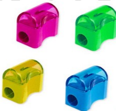
(Lote 01 – Item 05)