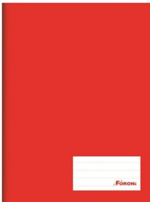
(Lote 01 – Item 13)