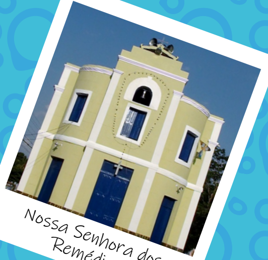
Nossa Senhora dos Remédios