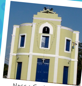
Nossa Senhora dos Remédios