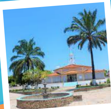
Cabeceiras do Piauí