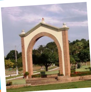
Morro do Chapéu