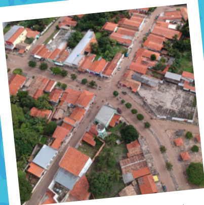
São João do Arraial