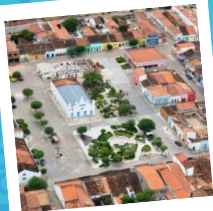
Murici dos Portelas