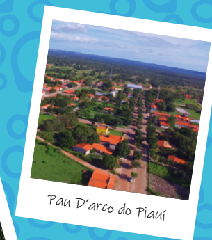
Pau D'arco do Piauí