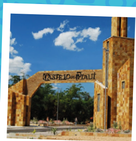
Castelo do Piauí