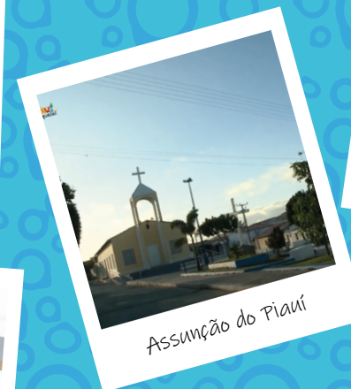
Assunção do Piauí