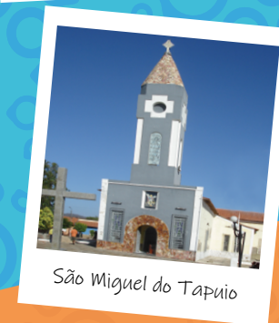
São Miguel do Tapuio