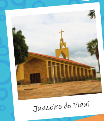
Juazeiro do Piauí