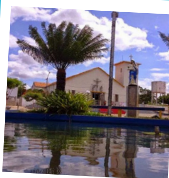
Buriti dos Lopes