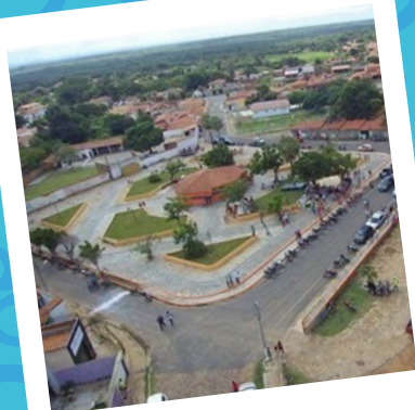
Capitão de Campos