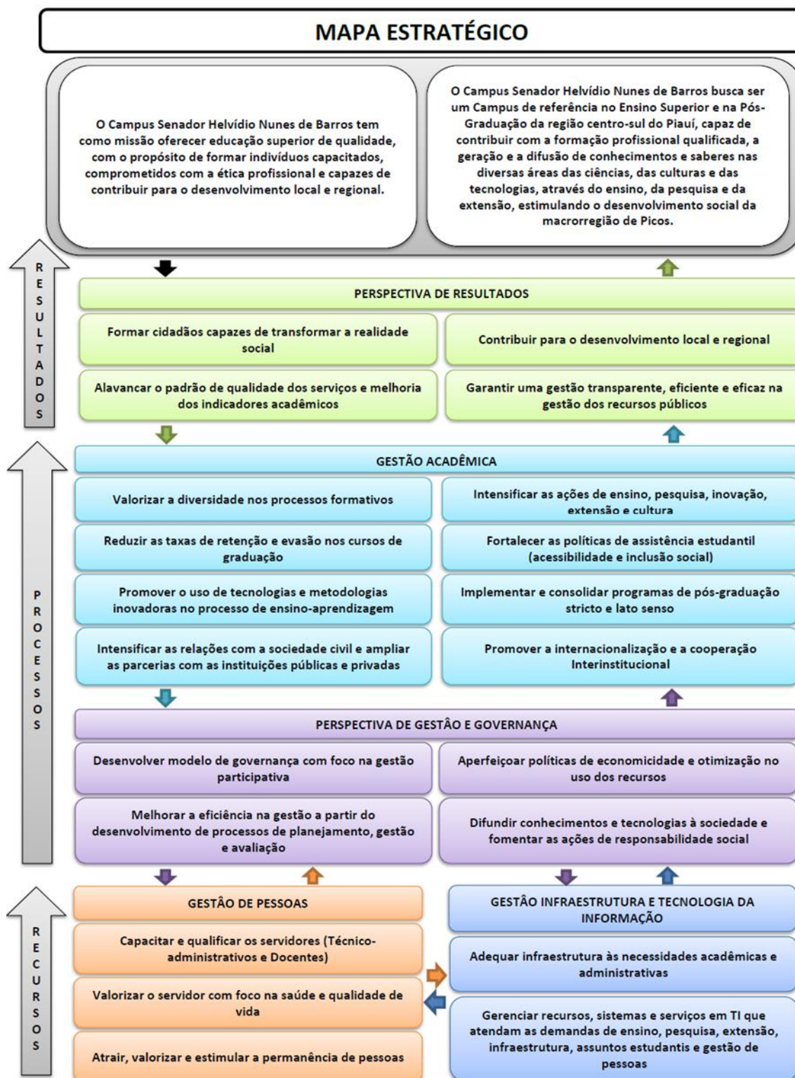
Figura 02. Mapa estratégico do campus Senador Helvídio Nunes de Barros.