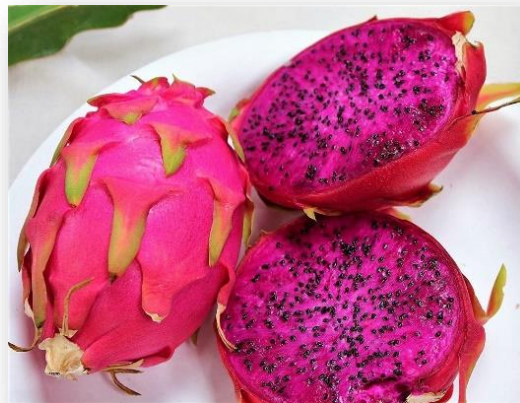
Figura 2. O fruto de Hylocereus polyrhizus Weber, a pitaia vermelha

A parte interna do fruto da pitaia vermelha (Figura 2) é constituída de inúmeras sementes de tamanho pequeno, distribuídas de maneira proporcional, representando, em média, 70% do peso total em frutos amadurecidos (LIMA et al. , 2013). Um fruto com marcante característica e beleza, sendo conhecido por diversos nomes. Os seus nomes são derivados das suas características, sendo um deles “rainha da noite”, pela particularidade da sua flor que só se abre em uma única noite e “Dragon Fruit” devido às escamas presentes ao longo do fruto, sendo semelhantes à pele de dragão (ANDRADE; MARTINS; SILVA, 2007).