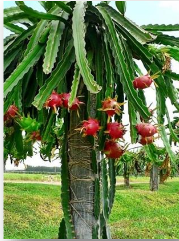
Figura 1. A espécie vegetal Hylocereus polyrhizus Weber, conhecida como pitaia.