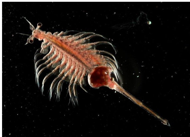
Figura 4. O micro crustáceo Artemia salina

A. salina (Figura 4) é uma espécie de micro crustáceo da ordem Anostraca, utilizada neste trabalho como bioindicador de toxicidade. É um crustáceo filtrador que se alimenta basicamente de bactérias, algas unicelulares, pequenos protozoários e detritos dissolvidos no meio. A filtração ocorre nos toracópodos, encarregados de conduzir as partículas alimentícias em direção ao sistema digestivo. A taxa de filtração diminui com o aumento da concentração de partículas, ficando estas acumuladas e interferindo o processo normal de seus batimentos. Outro efeito das altas concentrações é que podem passar diretamente pelo tubo digestivo sem sofrer digestão, tornando o indivíduo subnutrido (SOUTO, 1991).