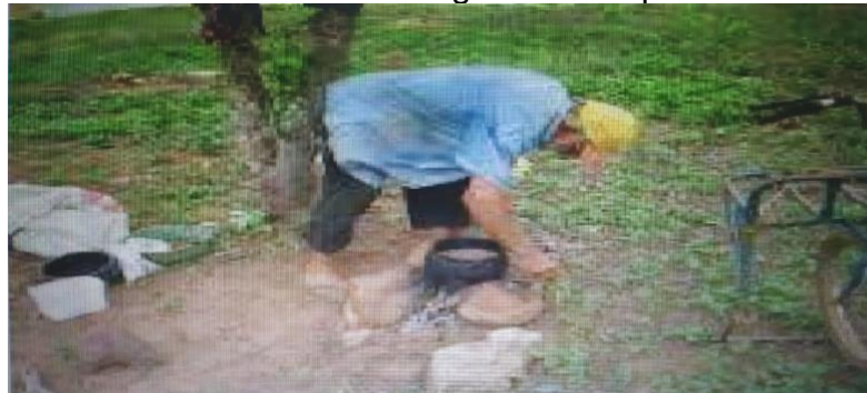
IMAGEM 1 - Fogão de trempe