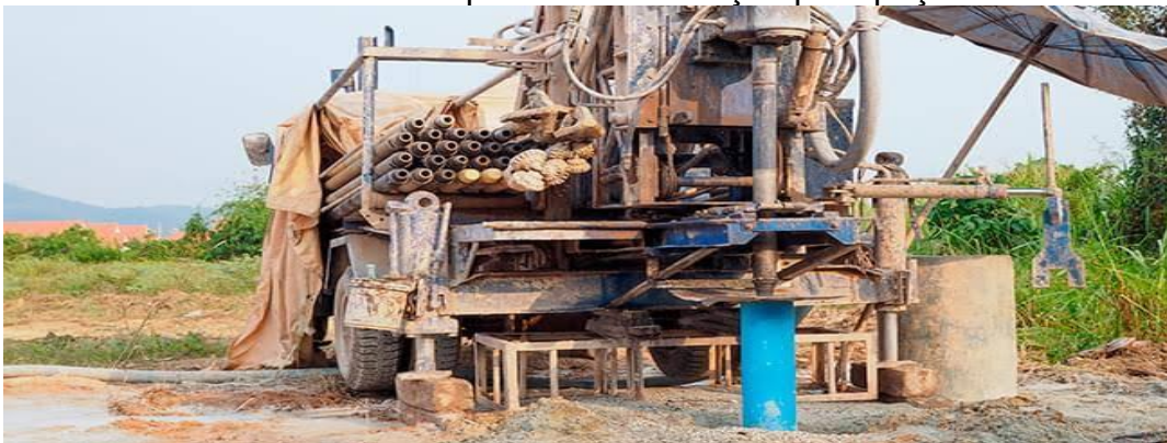
IMAGEM 7 - Maquinas de escavação para poços Tubulares

https://www.google.com/search?q=mAQUINA+DE+ESCAVA%C3%87%C3%83O+PARA+A+CONSTRU%C3%87%C3%83O+DE+PO%C3%87OS+TUBULARES&tbm=isch&ved=2ahUKEwjDhenp35DmAhU6CrkGHZ4qDQUQ2- . Acessado em: 20/11/2019.