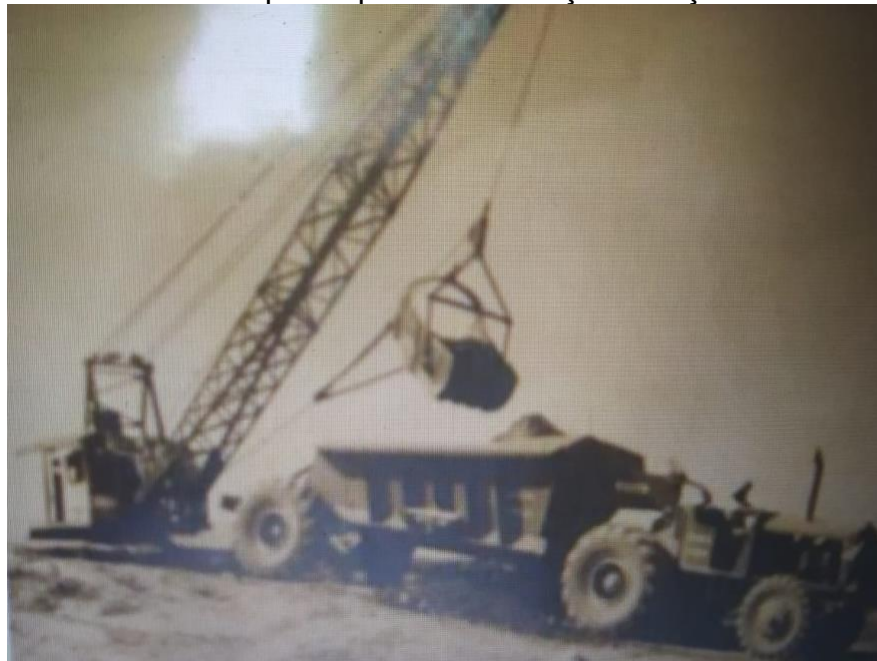
IMAGEM 4 - Maquinas para a construção de açudes