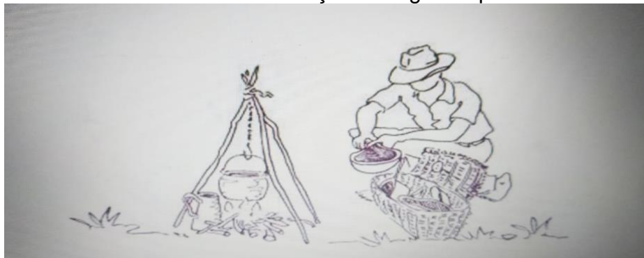
IMAGEM 2 - Ilustração do fogão tropeiro

Fonte: O Folclore das tropas, tropeiros e cargueiros no Vale do Paraíba - Tom Maia e Thereza Regina de Camargo Maia - MEC/Funarte-1980 (texto e gravuras).