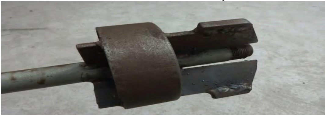
IMAGEM 6 - Broca de furar Poços Artesianos

DNOCS expõe apenas a construção de poços tubulares 54 . Os mesmos podem ser cavados por máquinas com sondas rotativas, que são as mais recomendadas para a perfuração em locais que possuem sedimentos; sondas percussoras, que são as mais indicadas para a perfuração de terrenos com características rochosas; e sondas rotopneumáticas, que possuem equipamentos mais atuais e por isso possuem recursos para atuarem em diferentes tipos de solos.