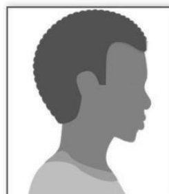
Figura 2. Modelo de Foto de Perfil