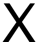
Foto candidato(a) a Chefe

As imagens dos(as) candidatos(as) devem ser individuais (uma do candidato a chefe e outra ao cargo de subchefe) e de rosto. Os arquivos devem ter aproximadamente 190 pixels de largura x 260 pixels de altura no formato PNG.