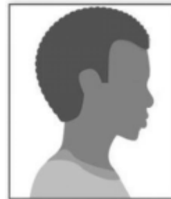
Figura 2. Modelo de Foto de Perfil