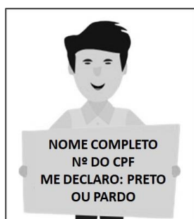
Figura 3. Modelo de Autodeclaração para o vídeo.