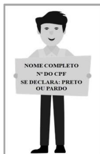
Figura 3. Modelo de Autodeclaração para o vídeo.