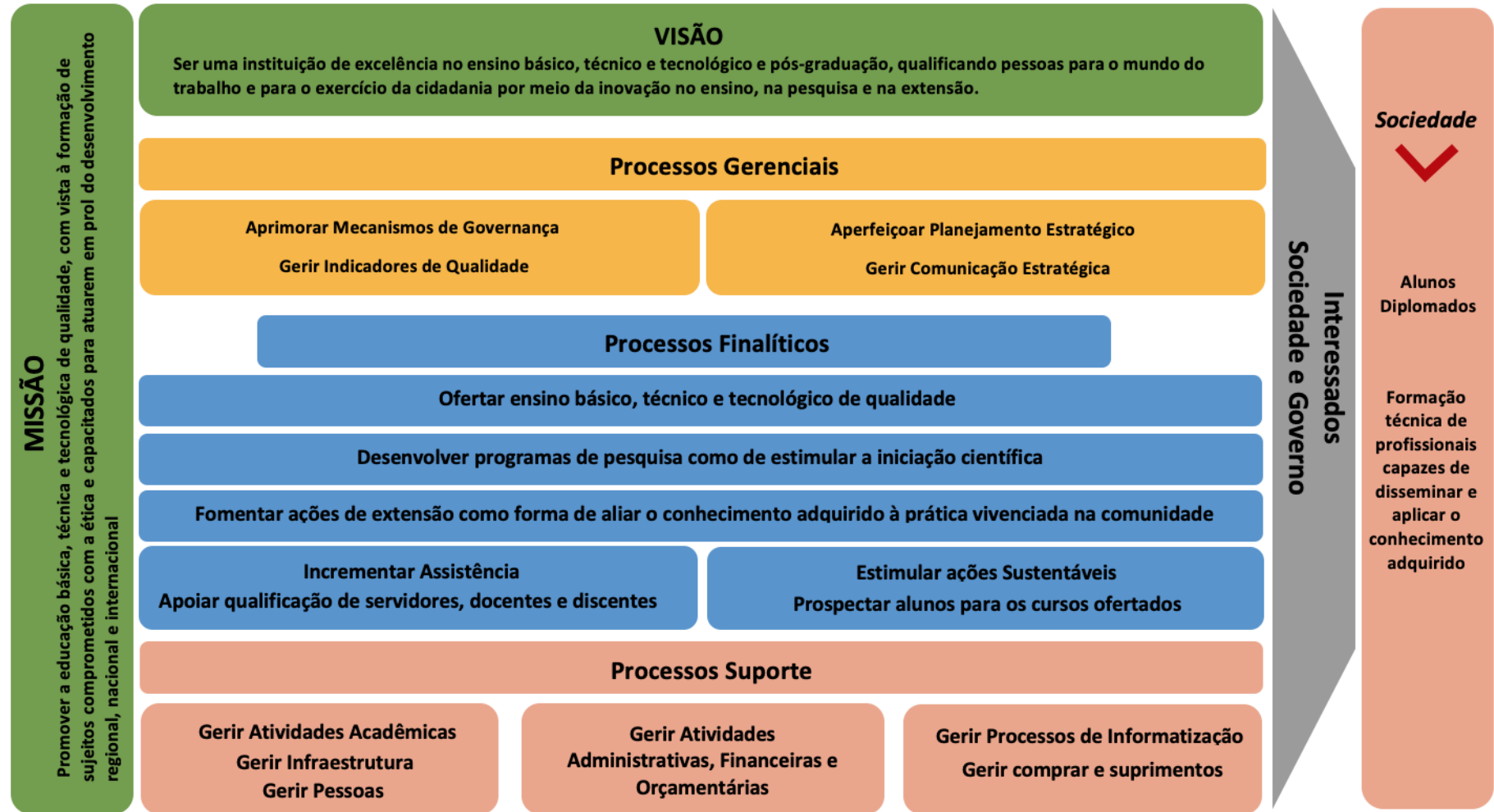
Figura 01 – Cadeia de Valor do CTBJ