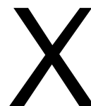
Foto candidato(a) a Coordenador(a)