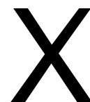
Foto candidato(a) a Subchefe