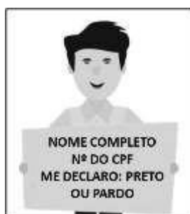
Figura 3. Modelo de Autodeclaração para o vídeo.