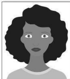
Figura 2. Modelo de Foto de Perfil