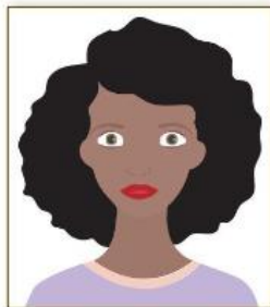
Figura 2. Modelo de Foto de Perfil