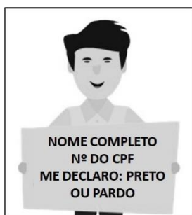
Figura 3. Modelo de Autodeclaração para o vídeo.