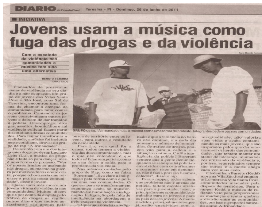
Figura 01 – Jornal aborda os jovens do grupo “A Irmandade” para falar do estilo musical Rap .