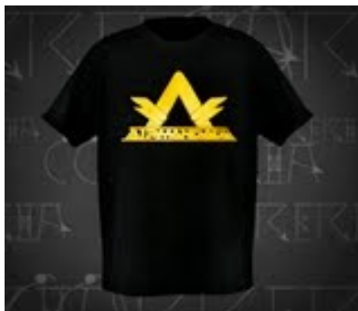
Figura 07 – Camiseta da grife “Correria” com o novo design (logomarca) do grupo “A Irmandade”.