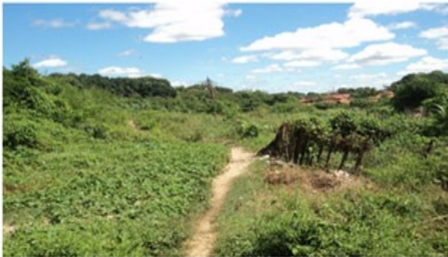
Fotografia 11 – Cenário em que se passa o clipe “Criptonita” do grupo “A Irmandade”.