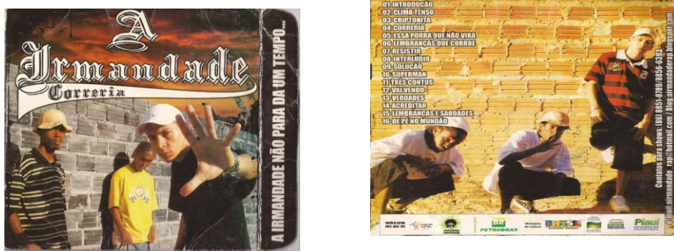
Figuras 02 e 03 – Capa do CD “Correria”, lançado pelo grupo “A Irmandade”.