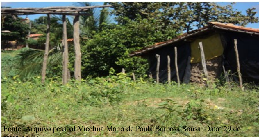
Fotografia 10 – “Barraco” em que se passa cenas do clipe “Criptonita” do Grupo “A Irmandade”.

Data: 29 de maio de 2011.