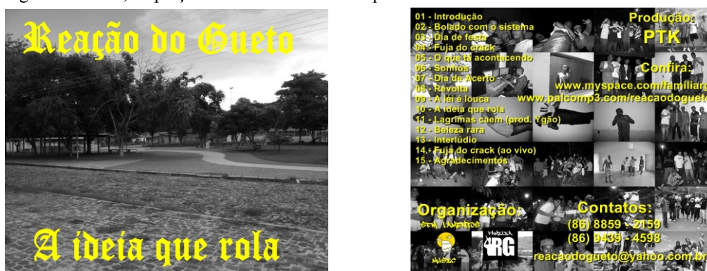
Figuras 10 e 11 – Capa do primeiro CD do grupo “Reação do Gueto”, lançado dia 28 de agosto de 2011, na praça da Santa Maria da Codipi.