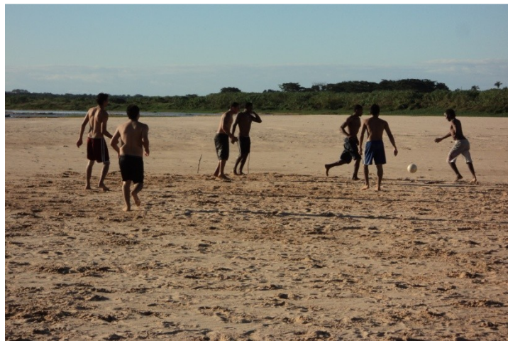
Fotografia 04 – Momento de lazer, uma partida de pelada entre amigos e os integrantes dos dois grupos “A Irmandade” e “Reação do Gueto”.

Data: 03 de julho de 2011.