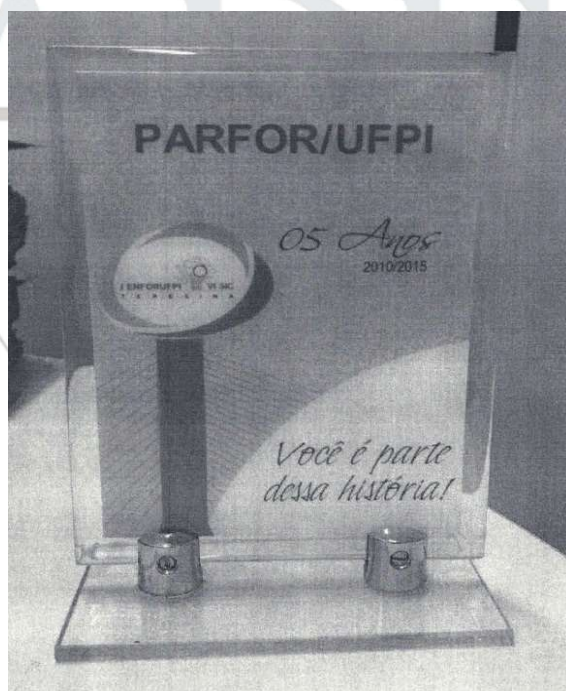
[Lote 01 – Item 09]