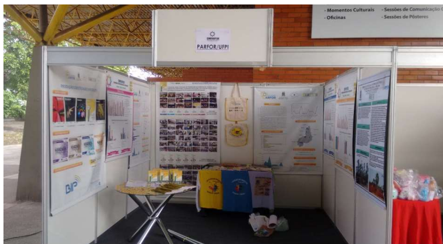
Lote 03 – Item 03