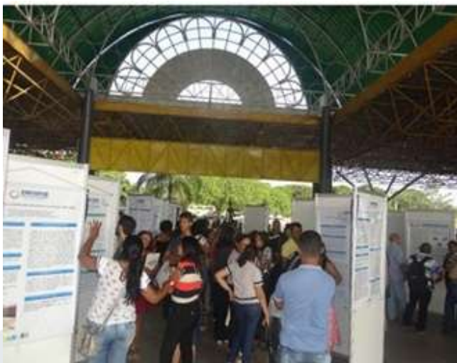
Lote 03 – Item 01