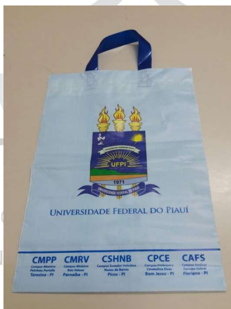
[Lote 02 – Itens 03, 04 e 05]