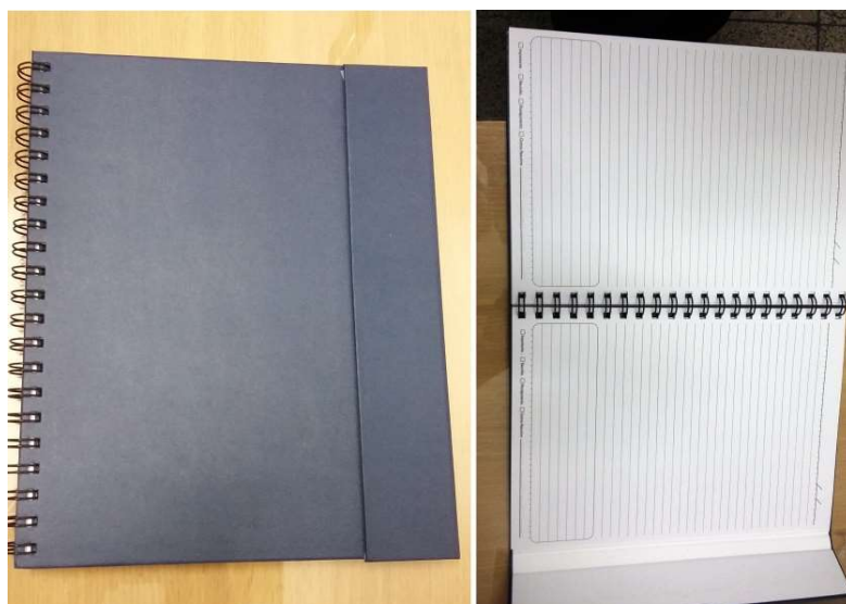
[Lote 01 – Item 03 e 04]