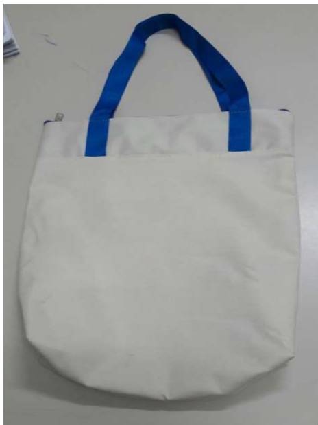
[Lote 02 – Item 01]