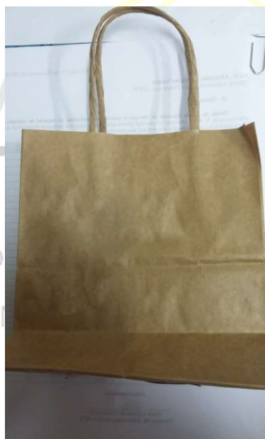
[Lote 01 – Itens 05, 06 e 07]