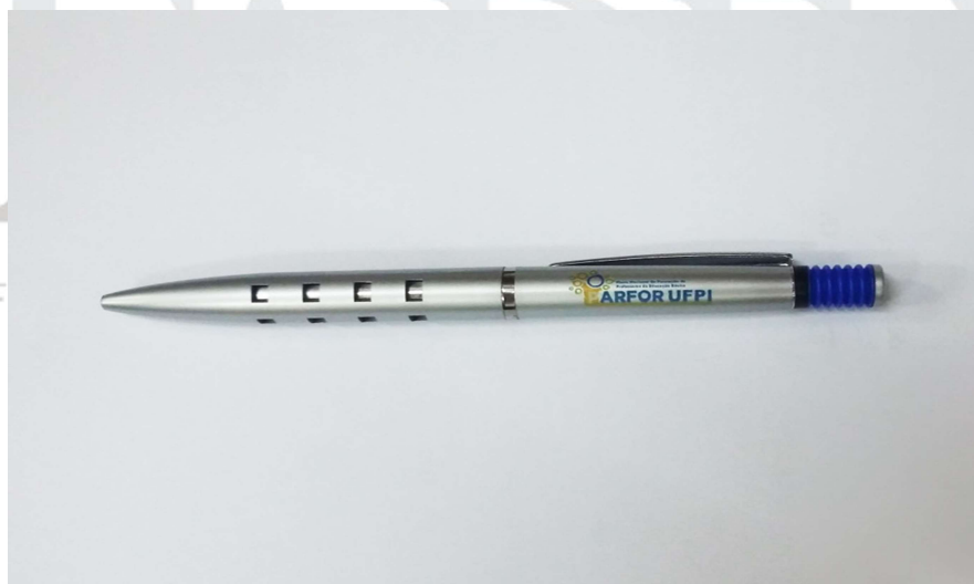
[Lote 01 – Item 02]