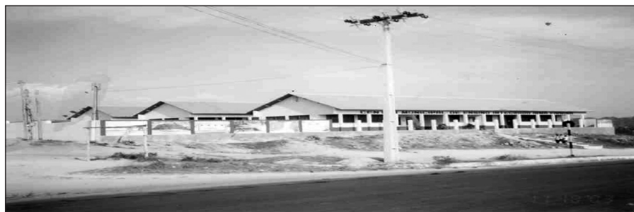
Foto 03 – E.M. Irmã Firmina onde funcionou o primeiro Núcleo de Interiorização da UFPA/Santarém, no município de Óbidos

Interiorização da UFPA, fora do Campus de Santarém, na cidade de Óbidos.