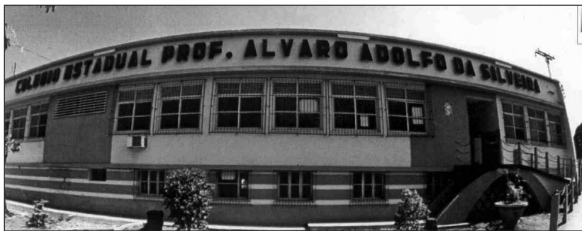
Foto 01 – Colégio Álvaro Adolfo da Silveira onde funcionou o primeiro Núcleo de Educação de Santarém

Reitera-se, em pleno período de implantação da Reforma Universitária (Lei nº 5.540/1968), da Reforma da Educação Primária (Lei nº 5.692/1971) e da aprovação do Plano Decenal de Educação da “Aliança para o Progresso 5 ”, aliás, foi este Plano que estabeleceu as diretrizes técnicas da Escola Polivalente no Brasil, seguindo as orientações da Carta de Punta del Este (1961) e das Conferências realizadas em Santiago do Chile, em março de 1962, e, em Bogotá na Colômbia, em agosto de 1963.